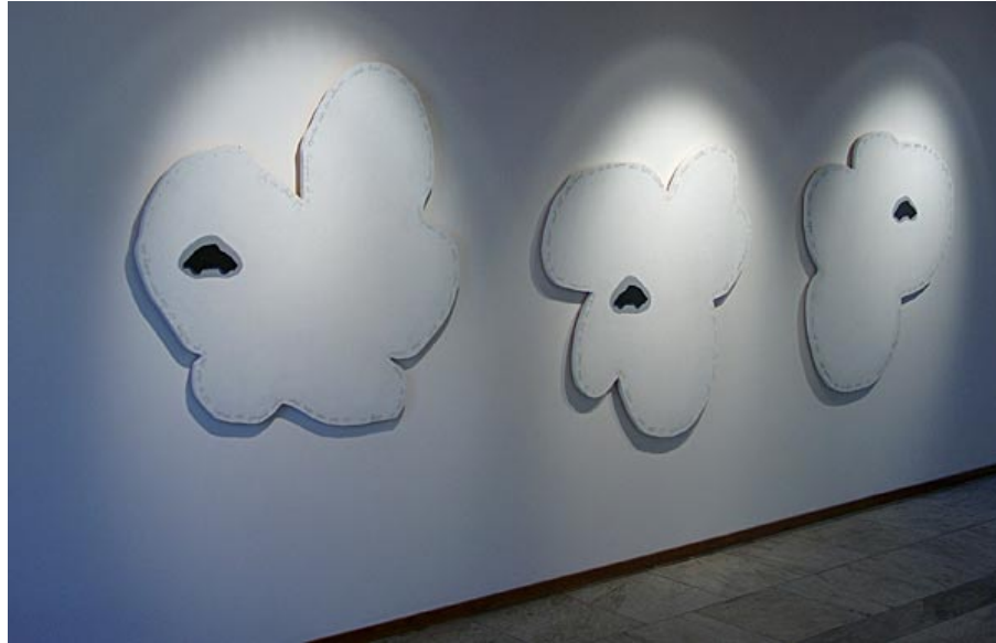
“Barnatro”, Piteå Konsthall 2006 120x120 cm i MDF