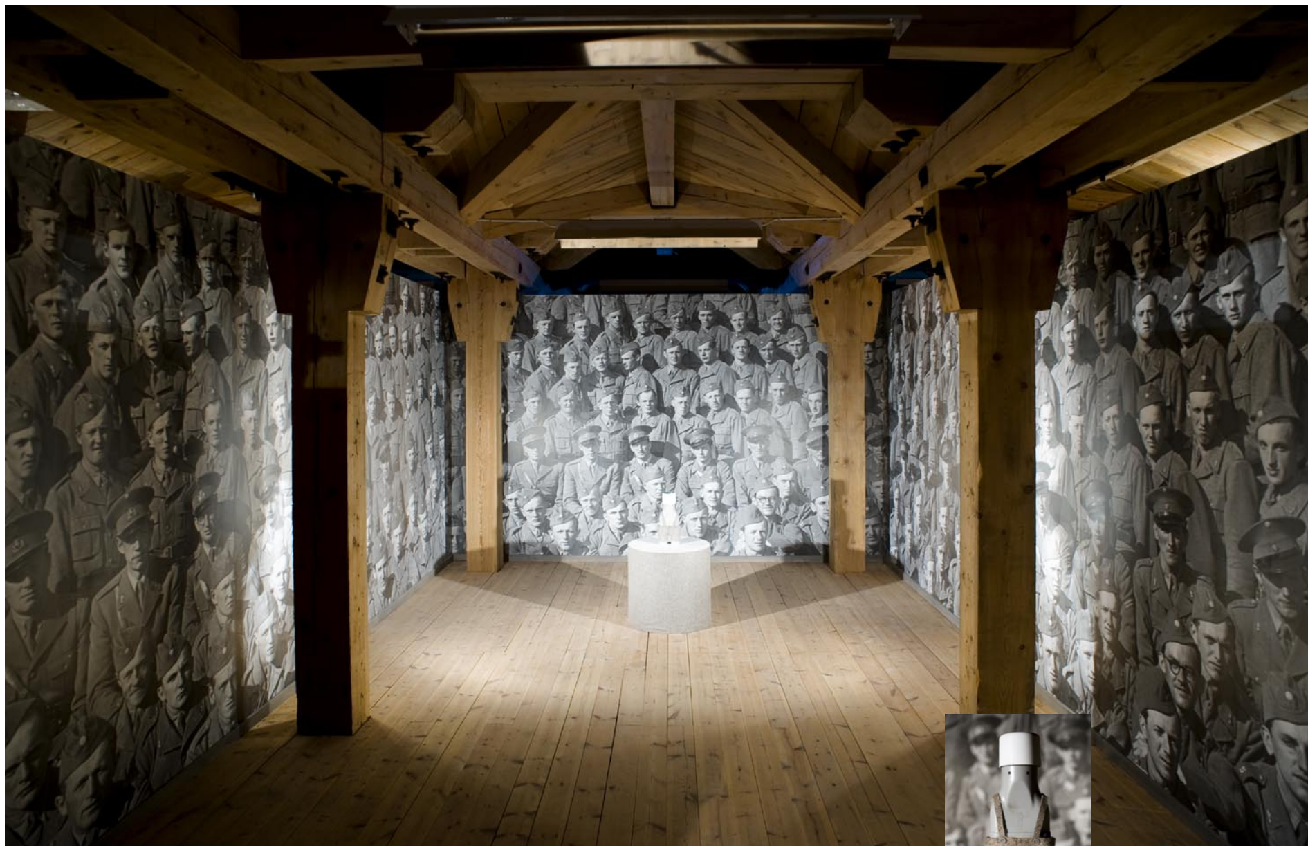
“Pappa var är du?”. - medverkan i temautställning “Ryssen kommer”. Om rädsla, främlingskap och konsten som fredsbevarare. Havremagasinet, Boden 2010.