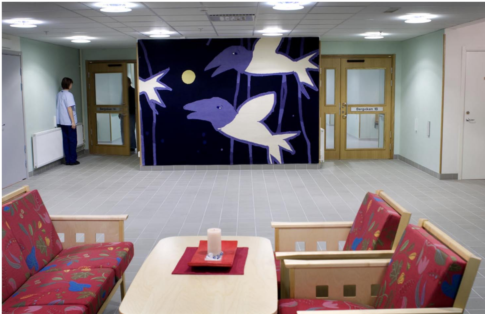
"HAPPY BIRDS" - Midskogs äldreboende i Luleå. Tuftad matta, 340x270 cm, producerad på Kasthall 2007.