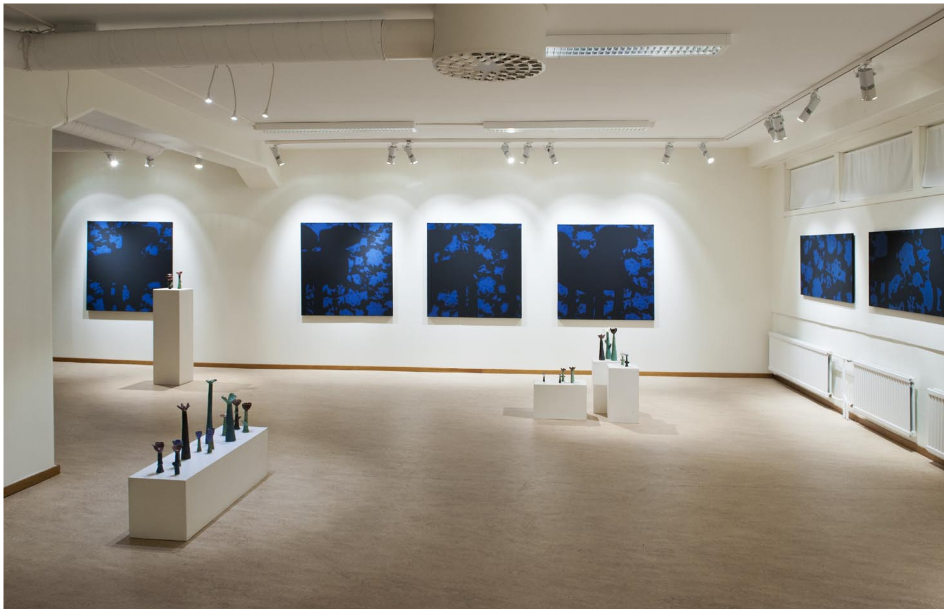
Från utställningen "När och fjärran" i Boden tillsammans med Pia Schmaltz, nov 2014. 12 målningar kallade "Där rosor aldrig dör". En slags bakgrundsdekor till Pias keramik - 40 st individuella blommor.