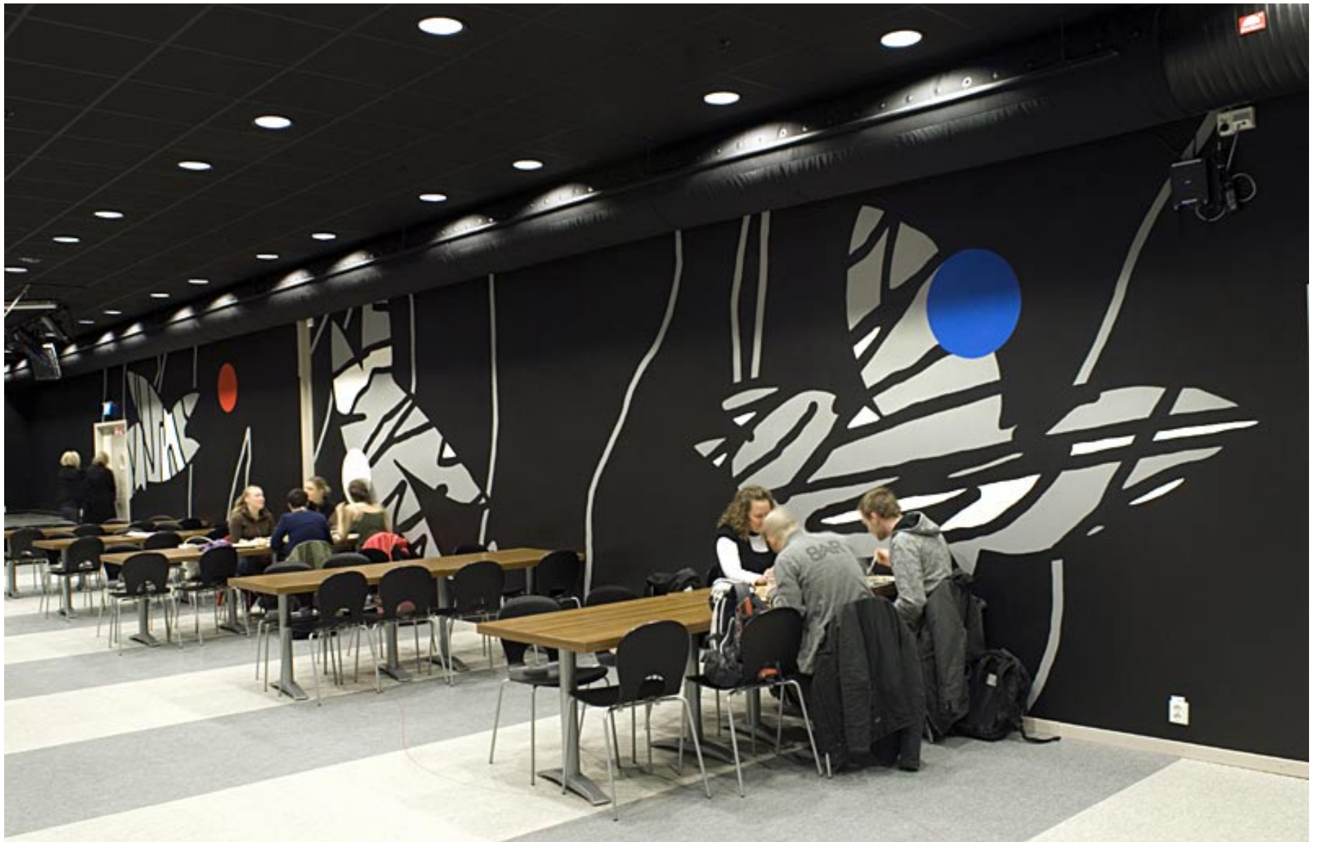
“BEBOP TANGO” - 30m vägg i studentrestaurangen STUK, Luleå Tekniska Universitet 2007.